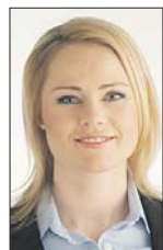
NATALIE RICKLI NATIONALRÄTIN SVP WINTERTHUR

Der SVP weht derzeit ein eisiger Wind entgegen. Die meisten Medien schreiben schlecht über unsere Partei. Dies ist nicht neu, im Gegenteil: Eine Partei, welche den Mut hat, auch unangenehme Themen anzusprechen, steht bald im Kreuzfeuer der Öffentlichkeit. Doch unser Land braucht eine Partei, welche die Kraft hat, Nein zu sagen, Missstände aufzudecken und dem «Mainstream» entgegenzuhalten. Eine Partei, welche Widerstand leistet – Widerstand für diejenigen Werte, welche unser Vaterland stark gemacht haben.